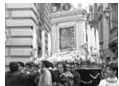
IL QUADRO DELLA PIETÀ DEI MASSARI

La Pietà dei Massari è senza dubbio un'altissima espressione di devozione, tra il caratteristico suono delle «ciaccolle» e le tristi note funebri; tra i momenti più importanti il passaggio per le vie Nunzio Nasi e Custonaci, e la tradizionale entrata e sosta al Palazzo Fodale in piazza Matteotti, per ricordare quando il quadro fu custodito in quel palazzo durante il periodo bellico. La processione terminerà per oggi intorno alle 22.00 con l'entrata nella capanna che ogni anno viene allestita in Piazza Lucatelli, dove verrà vegliata per tutta la notte, per poi ricominciare domani sera in cui, dopo un breve tragitto, la Pietà ritornerà al Purgatorio. Domani invece sarà il turno della