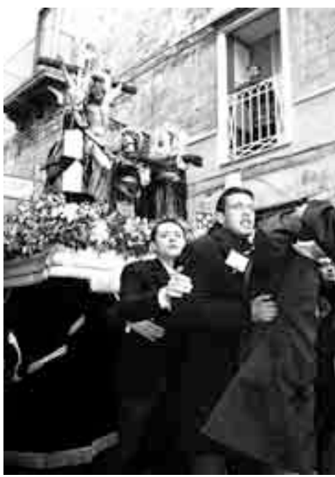
MOLTO COMPOSTI I PORTATORI DEI GRUPPI