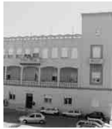
POLITICA IN FERMENTO A VALDERICE