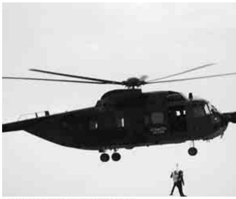
IL SOCCORSO DEL FERITO CON L'ELICOTTERO DEL SAR

È stato trovato privo di conoscenza e ha fratture in varie parti del corpo e un trauma cranico. La prognosi è riservata. I soccorsi hanno atteso l'arrivo dell'elicottero del Sar