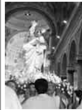
MADONNA IN PROCESSIONE